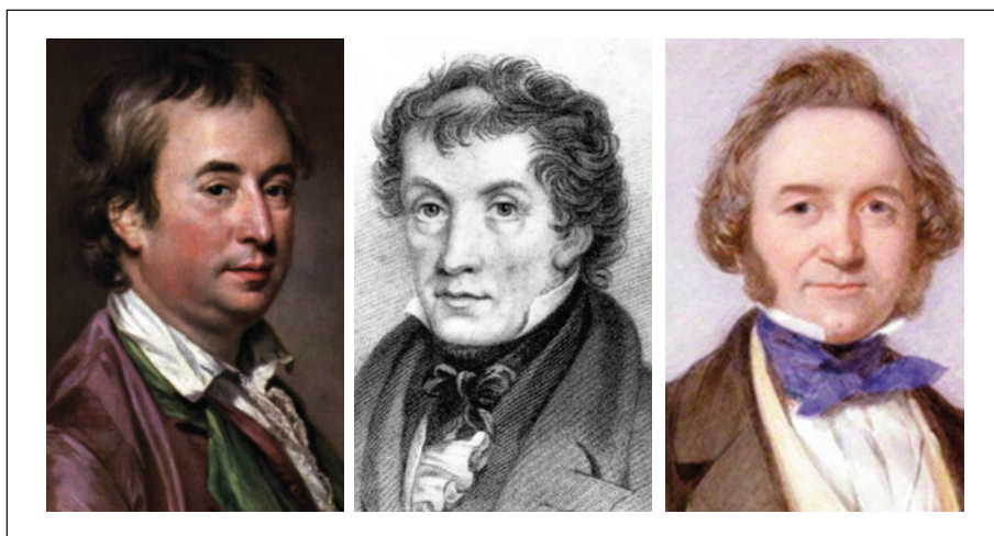
FIGURA 2. Paisatgistes anglesos que van introduir les noves modes jardineres del segle XIX en les quals es prioritzava l'ús de les plantes exòtiques en els jardins (d'esquerra a dreta): William Chambers, John Claudius Loudon i Joseph Paxton

Les primeres exposicions universals (Londres, 1851; París, 1855, i d'altres) també van marcar tendència en l'ús de rareses botàniques en jardineria. És força interessant la història del disseny de l'estructura del Crystal Palace, seu de la primera Exposició Universal, a Londres. Va ser dissenyat pel mateix Paxton, que es va inspirar en el revers de les fulles de nenúfar gegant (Pueyo, 2015).