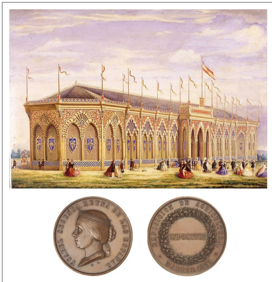
FIGURA 3. Pavelló de l'Exposición General de Agricultura de Madrid del 1857 (aiguada de Francisco Jareño) i medalla commemorativa