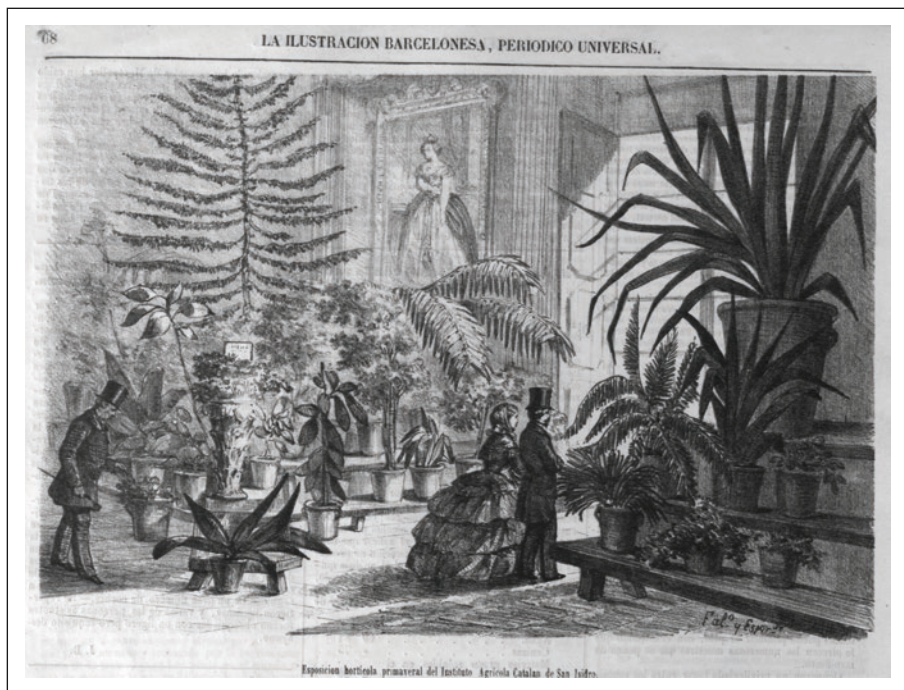
FIGURA 4. Aspecte de l'Exposició de Flors i Plantes de Barcelona del 1858